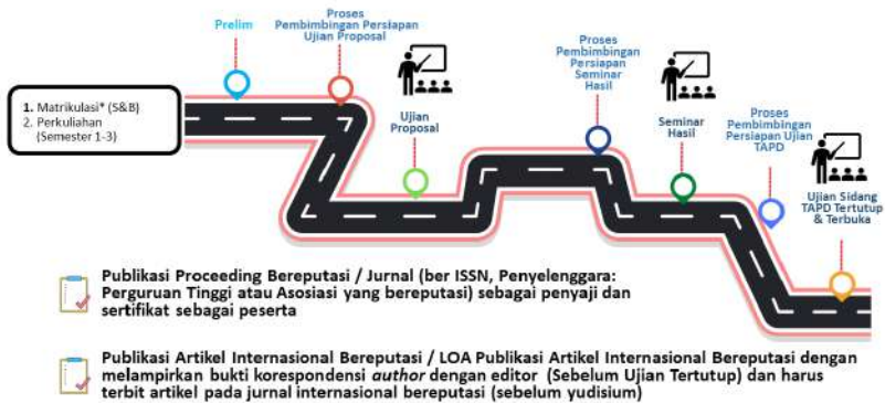
Gambar 2 Pola Pembimbingan TAPD