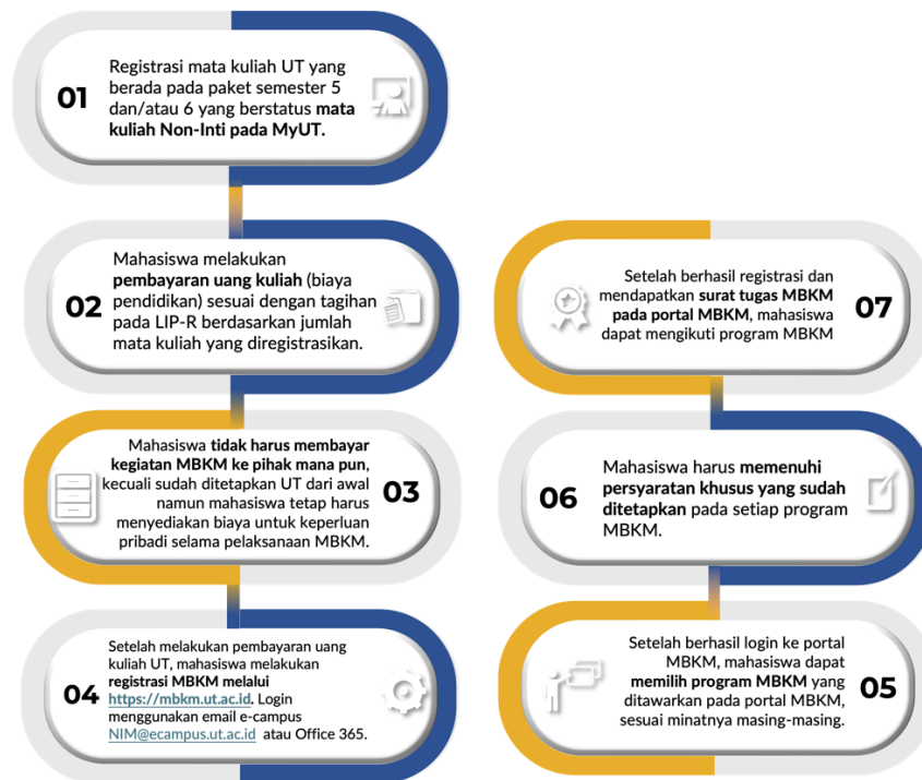
Gambar 3. Alur Registrasi dan Biaya Pendidikan