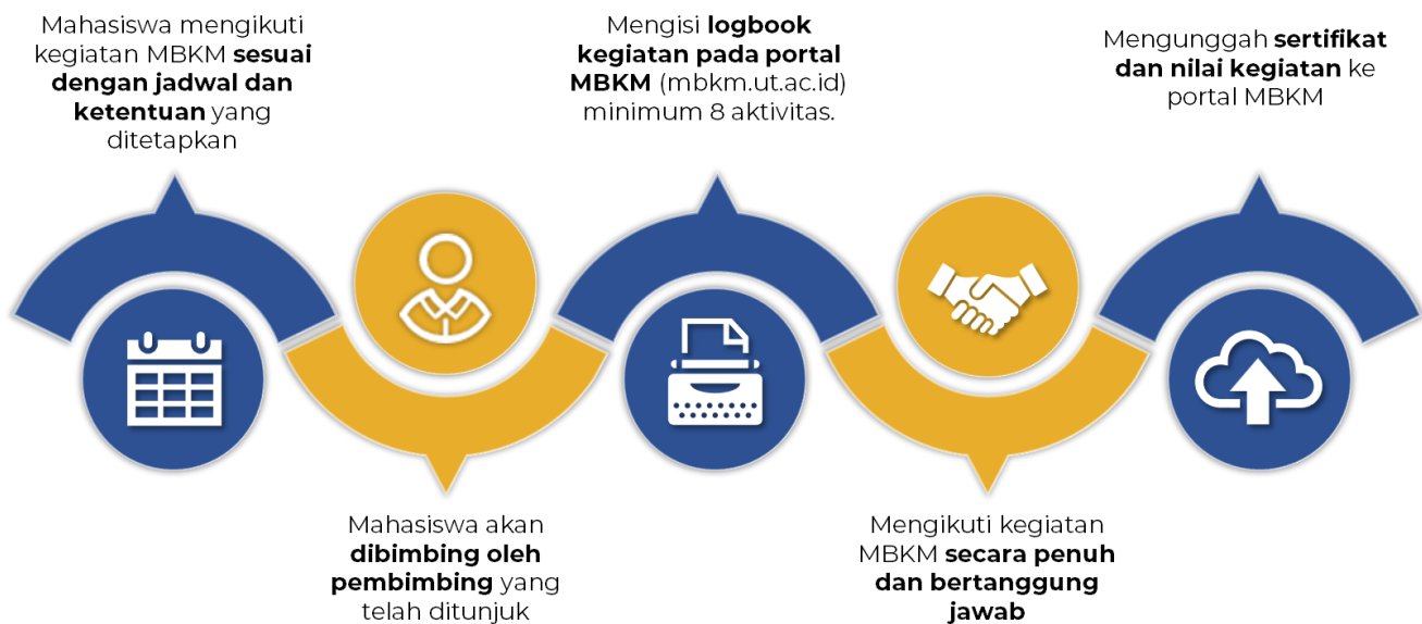
Gambar 4. Alur Pelaksanaan MBKM Kemendikbudristek