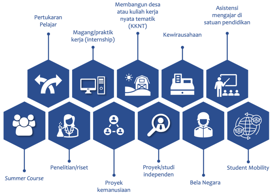
Gambar 2. Program - Program MBKM