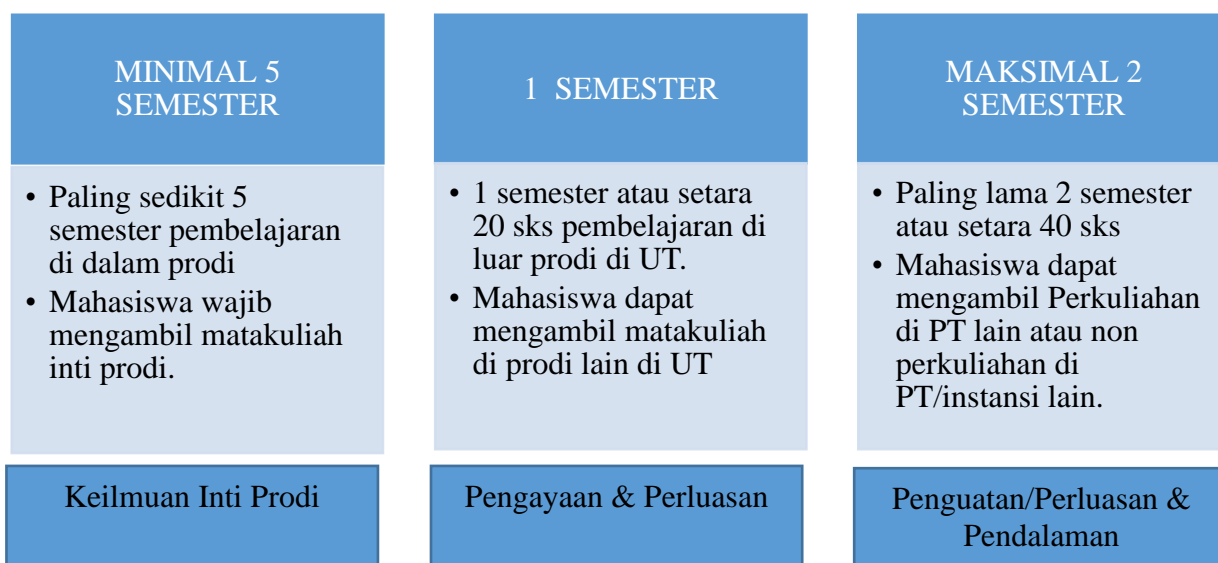
Gambar 1. Desain Implementasi Kurikulum MBKM

Pertama , mahasiswa wajib mengambil mata kuliah pada Program studi, minimal selama 5 semester atau setara dengan 84-86 sks. Mata kuliah yang diambil pada prodi adalah mata kuliah inti yang wajib diambil sebagai mata kuliah disiplin ilmu prodi yang secara langsung akan mendukung pencapaian profil utama prodi dan atau mata kuliah lain yang diwajibkan. Mata kuliah pada kategori ini terdiri dari kelompok Mata Kuliah Keahlian Inti Prodi.